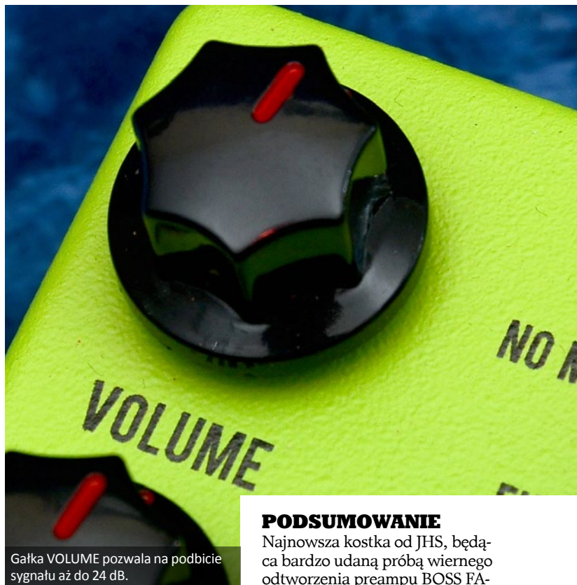
Gałka VOLUME pozwala na podbicie sygnału aż do 24 dB.

przez gałki korekcji. Przełącznik LOW CUT pozwala wyczyścić dolne pasmo, szczególnie przy większym gainie, a efektu JHS najczęściej po prostu nie chce się wyłączać. Brzmienie bardzo dobre robi się jeszcze lepsze, z możliwością fantastycznej, muzycznej korekcji, a barwa płaska (jeśli już mamy tę nieprzemijalność z nią obcować) nabiera życia i dynamiki. Do brzmienia singli Strata czy Tele dodamy głębokości i dynamiki, przy humbuckerach błyskawicznie zyskamy klarowność i definicję, bez zmiany naturalnego charakteru. Pomimo nienajniższej ceny, po kilku chwilach przekonujemy się o wartości takiego pedału w pedalboardzie lub po prostu przed wejściem wzmacniacza. Po sprawdzeniu JHS The Clover, szczególnie na scenie, z całą pewnością wielu gitarzystów poważnie będzie rozważać jego zakup. Dodatkowo The Clover dzięki wyjściu XLR sprawdzi się równie dobrze z gitarą akustyczną, nawet jako bazowy preamp, bądź przy podłączeniu do wzmacniacza basowego i gitary basowej. Wyjście XLR pozwala też wyprowadzić bardzo dobrej klasy sygnał równoległe np. do interfejsu audio, by później wykorzystać sygnał np. z software'owymi symulacjami.