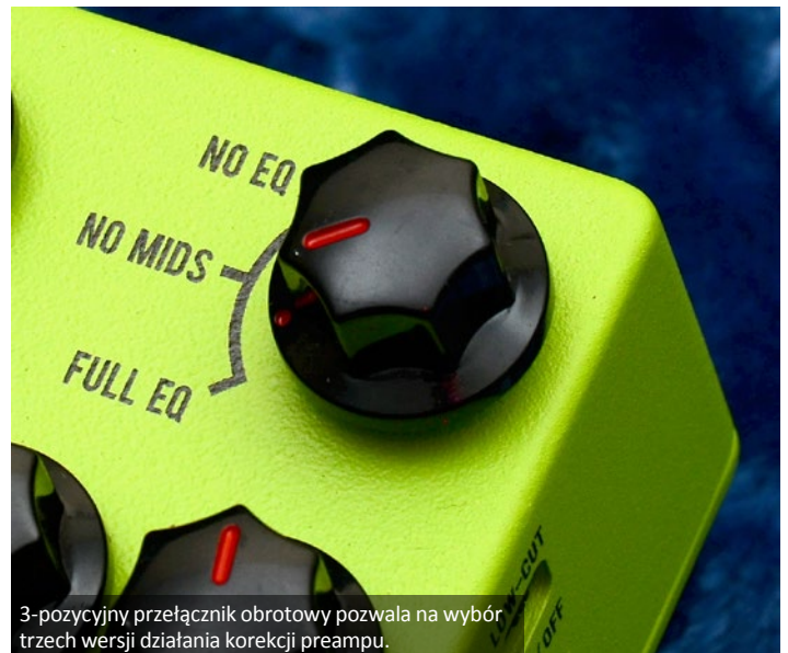
3-pozycyjny przełącznik obrotowy pozwala na wybór trzech wersji działania korekcji preampu.

korekcję oraz trzy tryby działania preampu, gdzie możemy też korekcję zupełnie pominąć lub zastosować wspomniany tryb FA-1 (No Mid). The Clover znakomicie wręcz dopala lampowy preamp na każdym poziomie gainu, nie zaburzając bazowego charakteru, a dzięki ultra-transparentnemu obwodowi idealnie sprawdza się też przy wspomnianym podrasowaniu naszej barwy, subtelnie dodając sustainu i harmonicznych do kanału czystego przy gałce VOLUME ustawionej na godz. 9:00. W tym wykorzystaniu możemy wprowadzić niuanse na nowy poziom, z lepszą nawet dynamiką całości, albo delikatnie podbić brzmienie przy okazji lekko wydobywając harmoniczne w wybranym paśmie