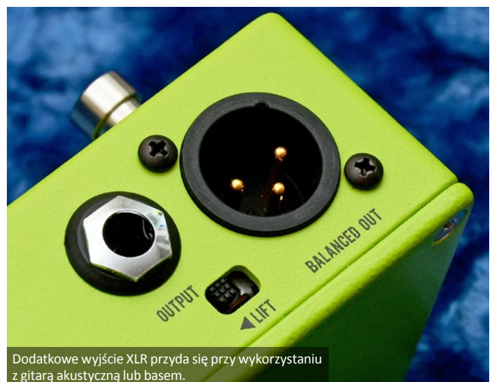
Dodatkowe wyjście XLR przyda się przy wykorzystaniu z gitarą akustyczną lub basem.