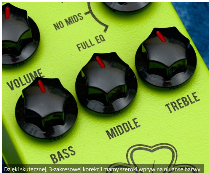
Dzięki skutecznej, 3-zakresowej korekcji mamy szeroki wpływ na niuanse barwy.