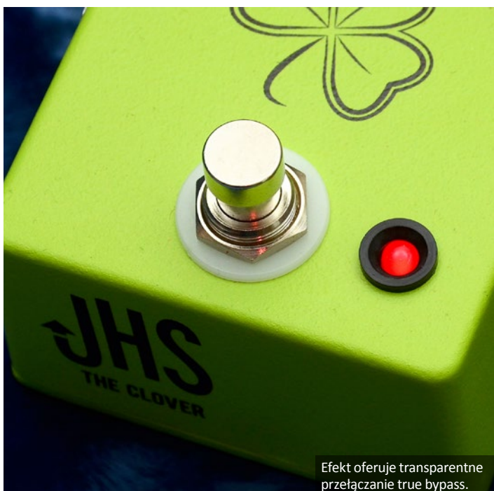
Efekt oferuje transparentne przełączenie true bypass.