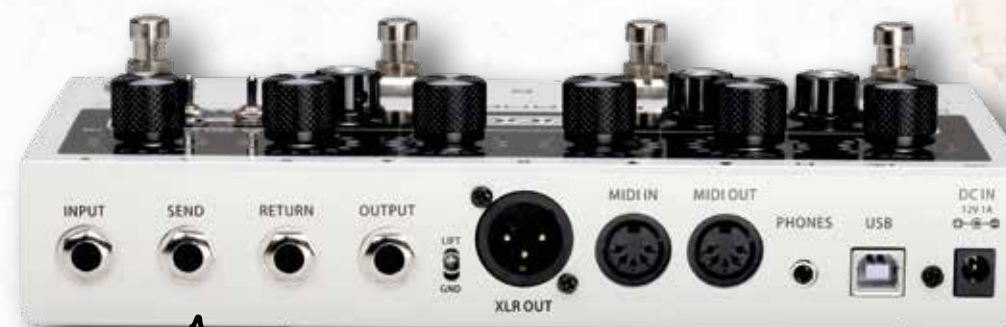
DE PREAMP LIVE HEeft GEEN INGEBOWDE EFFECTEN. DIE VOEG JE TOE VIA DE EFFECT LOOP ('SEND' EN 'RETURN')

ENIG De Preamp Live is eigenlijk enig in zijn soort. Er zijn pedalen met de klank van een versterker en er zijn multi-effecten met versterkermodeling. Maar een pedaal met verschillende digitale voorversterkersounds zonder verdere effecten, dat zie je niet veel. De Preamp Live is degelijk gebouwd en werkt goed en eenvoudig, zowel thuis als op het podium. Ideaal pedaal voor wie versterkerklanken naar zijn pedalboard wil brengen. Opnemen kan ook, maar daarvoor heb je wel een externe audio-interface nodig. De usb-aansluiting is alleen voor de Studio software en voor updates. 🎧